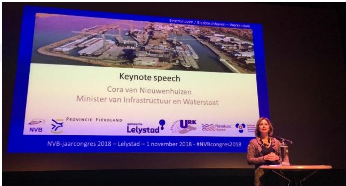
Cora Van Nieuwenhuizen, minister van Infrastructuur en Waterstaat sprak de aanwezigen tijdens het NVB-Jaarcongres in Lelystad toe