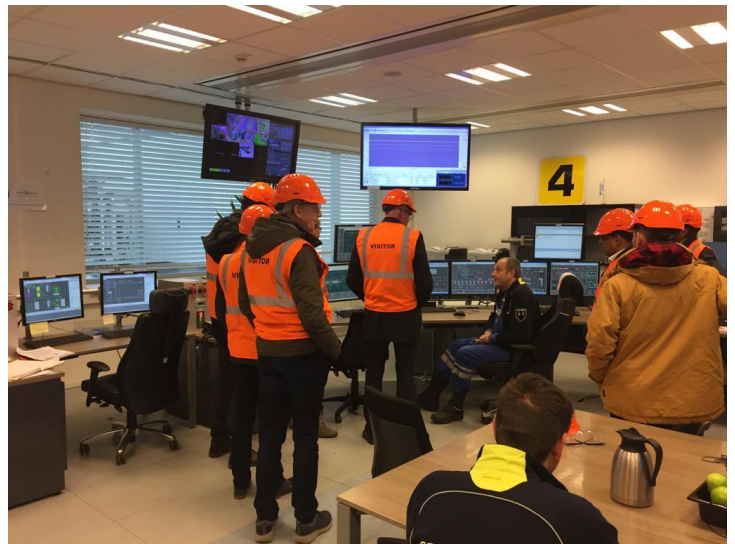
Op excursie bij Flevokust Haven en de Máximacentrale tijdens het NVB-Jaarcongres in Lelystad