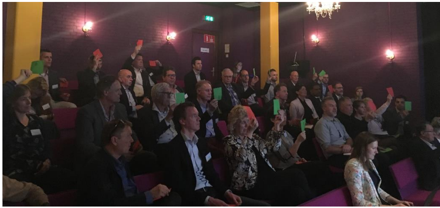
Deelnemers tijdens NVB-Masterclass “Duurzame haven dankzij slimme havengeldstructuur” op 12 april 2018