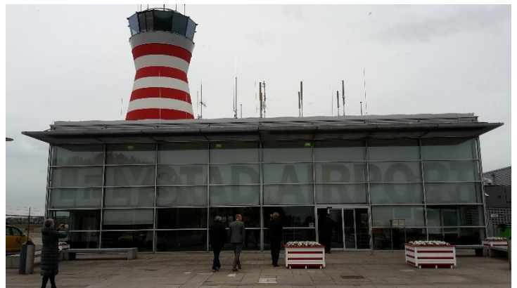
Op excursie naar Lelystad Airport tijdens het NVB-Jaarcongres in Lelystad