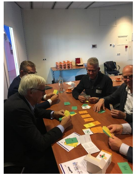
Leden actief aan de slag tijdens NVB-Masterclass ‘Binnenhavens: revitaliseren met behoud van omgevingskwaliteit’ op 31 oktober 2018