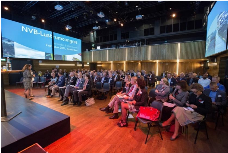
NVB-Lustrumcongres, 7-10-2016 in Pakhuis de Zwijger, Amsterdam