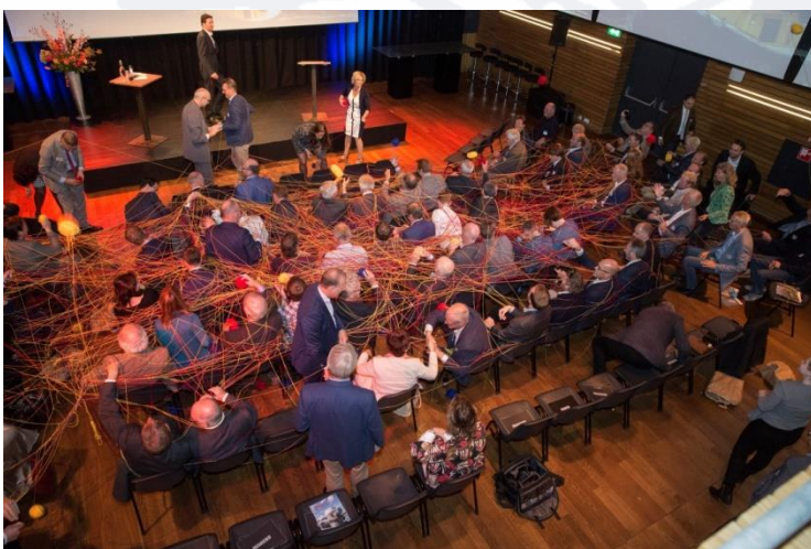
Afsluiting van het NVB-Lustrumcongres