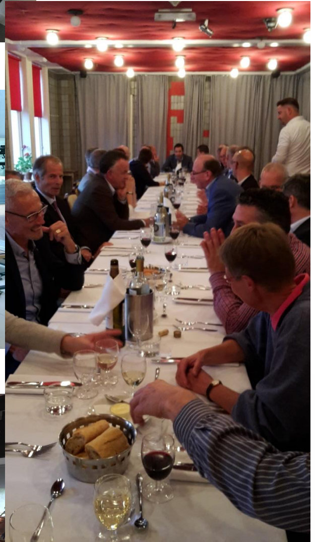
Ledendiner op 6 oktober