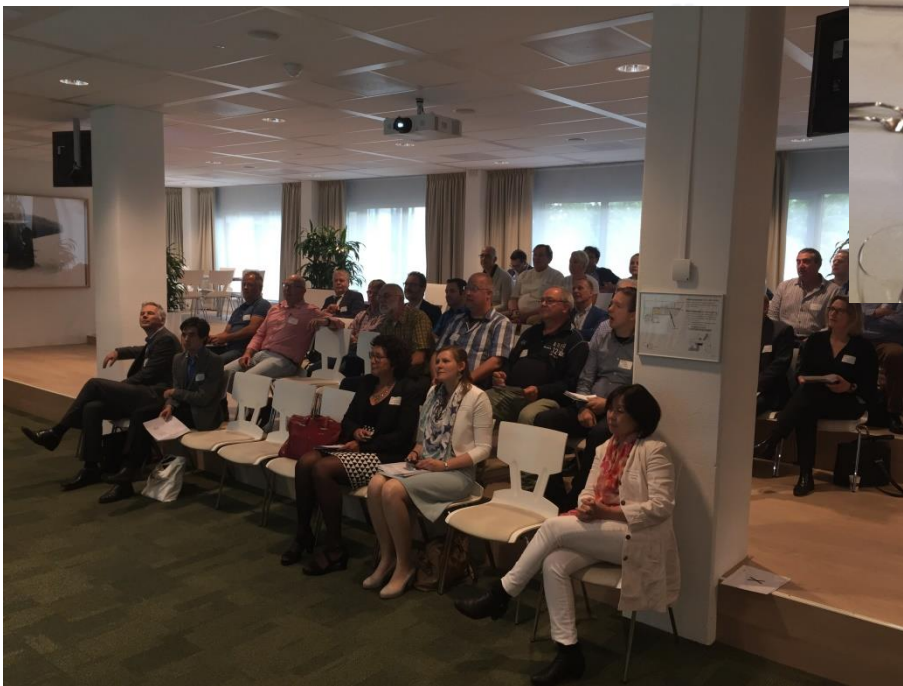
Goed gevulde zaal bij NVB-Masterclass Havensamenwerking op 29 juni 2016