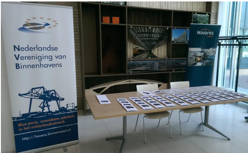
Ontvangst bij Movares voor NVB-Masterclass Havensamenwerking