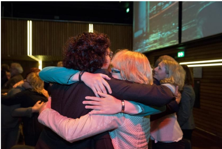
Verbinden & Vernieuwen op het NVB-Lustrumcongres