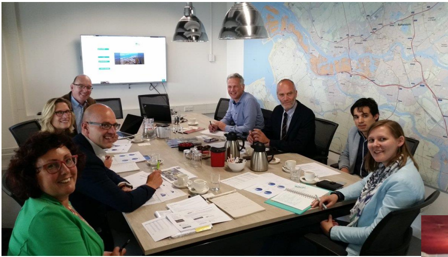
Brainstormsessie met geassocieerde partners over organiseren masterclasses